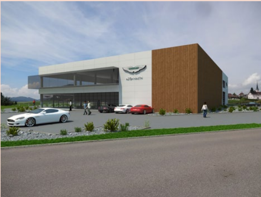
Das geplante neue Autohaus von Aston Martin St. Gallen